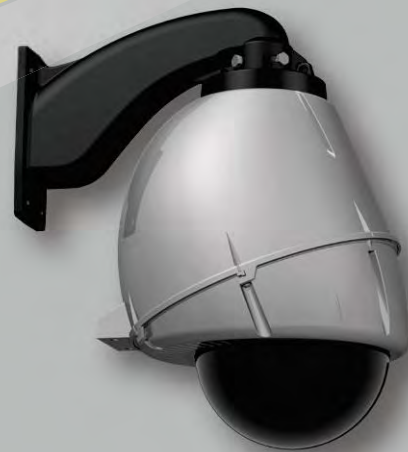
屋外軒下用サンシールド無しタイプ